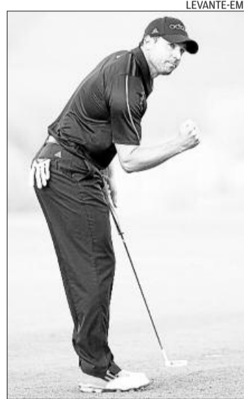
Sergio García, contento en Catar.

► La ventaja que tienen los jugadores de golf es que, cuando llegan a una determinada edad, pasan a denominarse «senior». Lo cual está muy bien, ya que ese nombre es el que, en casi el resto de deportes, tienen los deportistas que están en plenitud. En lugar de llamarse «veteranos», que sería lo más normal, estos senior acumulan toda la experiencia del mundo. Y para dar la bienvenida a los que superan ese umbral, se celebra todos los años