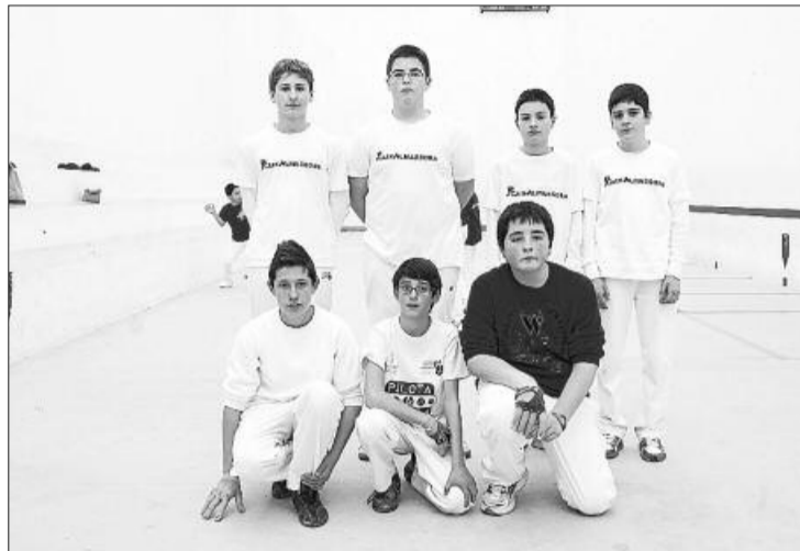
Almassora disputará la final provincial. LEVANTE-EMV

En la provincia de Valencia el pasado fin de semana se disputaron los cuartos de final en las categorías alevín, infantil y cadete en las localidades de Beniparrell y Godella. La escuela de Alfara de la Baronia consiguió clasificar a tres equipos para la disputa de las semifinales todo un éxito para