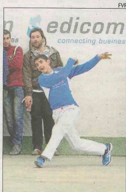
Quart de les Valls, en semifinales.

Estos clubes forman parte de los clásicos en la lucha por el título en casi cualquier competición en la cual participen. No en balde, Massalfassar es el claro dominador de esta competición, con trece trofeos de campeón. Siendo los del Camp de Morvedre los videntes subcampeones del torneo, así como finalistas del Autonómico en tres ocasiones en los