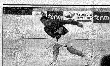
Bicorp defiende el título.