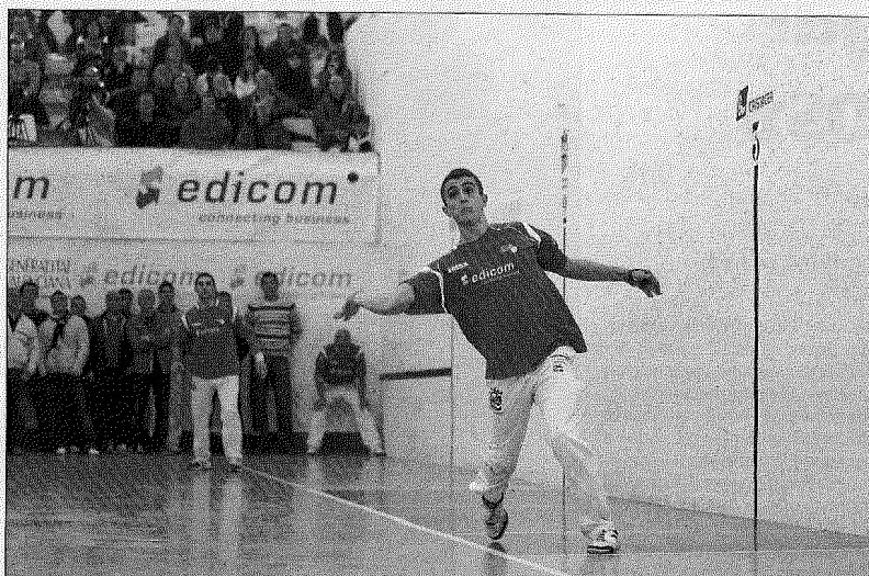
Beniparrell quiere desquitarse del subcampeonato pasado, de momento llega a semifinales... F.P.V.

Será Beniparrell, con el citado Roberto, Adrià, Ponce y Toni, como «feridor», quien se desplace a la cancha de Almenara, donde se enfrentarán con el equipo lo-