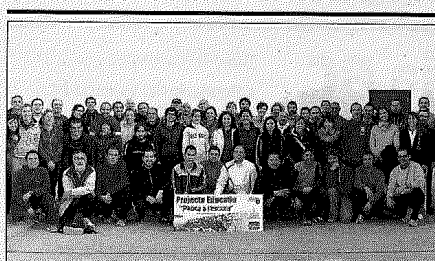
Los profesores se preparan.