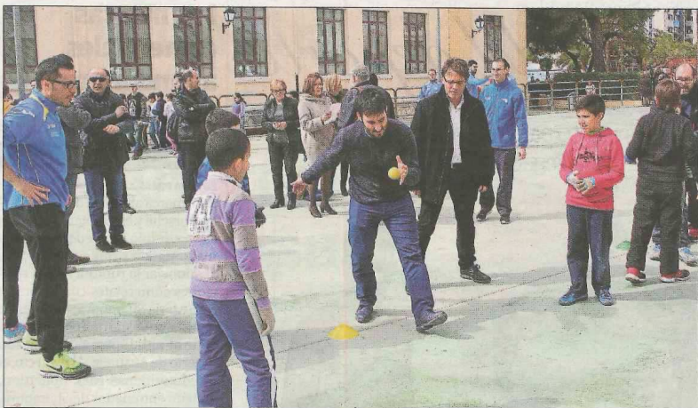
Marzá y Moya se atrevieron a jugar junto a los «pequeños pelotaris». FVP