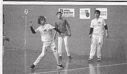
Les escoles del Puig i Vinalesa estaran en les finals. F.P.V.

El diumenge dia 22 de gener arrancarà una nova edició del Campionat Individual de Frontó al 4 i 1/2, després de l'èxit de la primera campanya de l'any passat. Es tracta d'una modalitat que és disputada per seus per a que cada diumenge és puga gaudir d'una bona jornada de pilota. Les seus que col·laboraran amb el campionat enguany són les d'Almussafes, Alfafar, Massalfassar, Godella i Borbotó. S'allargarà fins el mes de març i participaran un total de 36 jugadors, dividits en 4 categories. 8 d'ells jugaran en primera, 12 en segona, 8 en 3. a A i 8 en 3. a B.