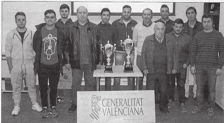
Els equips assistents a la presentació de la Copa Generalitat varen quedar molt contents de l'acte. FPV

El dimecres, i com a punt principal de l'acte, es va celebrar el sorteig dels emparellaments de les eliminatòries. En la categoria absoluta es varen donar enfrontaments que poden ser molt interessants. El primer de tots ells es el que tindrà a les formacions de Sella i Benimagrèl com a prota-